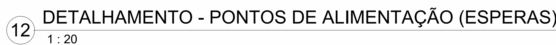
12 DETALHAMENTO - PONTOS DE ALIMENTAÇÃO (ESPERAS)