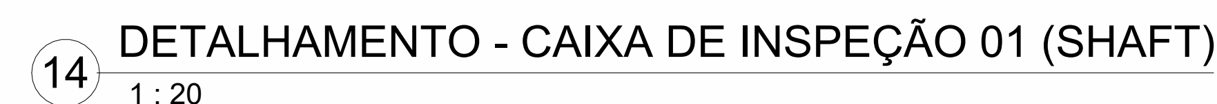
14 DETALHAMENTO - CAIXA DE INSPEÇÃO 01 (SHAFT)